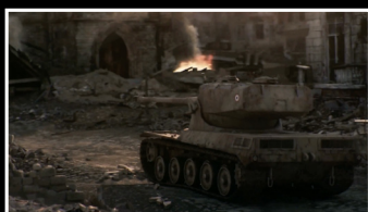
Игры и геймплей