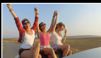
Стиль жизни, интервью