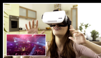
+ Эксклюзивный контент VR 360°